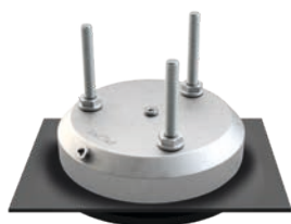
Pièce d'étanchéité DS180 UK I

UK I (Béton) – pour une hauteur d'isolation de 0 à max. 60 mm