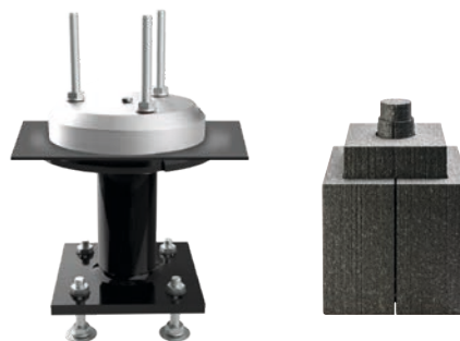
Pièce d'étanchéité DS180 UK II – B 55 – 200

UK II – B (Béton) 55 – 200 – pour une hauteur d'isolation de 55 à max. 230 mm (avec BefTec® jusqu'à 480 mm possible)